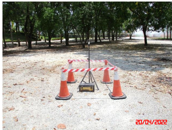
วัดหน้าเขาบ่อยาง