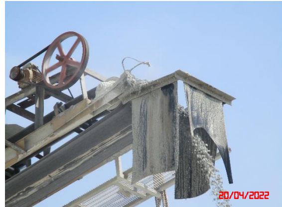
อุปกรณ์ปลายสายพานลำเลียง