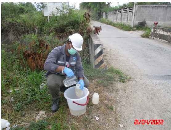
คลองบางโปรง