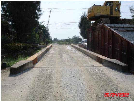
จุดซั้งน้ำหนักรถบรรทุก