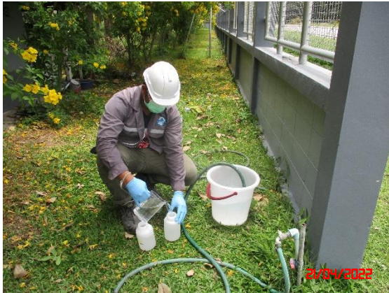
น้ำบ่อดินบ้านดอนกลาง