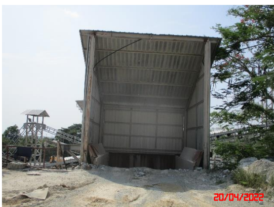
อาคารปิดคลุมอยู่รับหินใหญ่