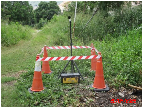
ชุมชนบ้านดอนกลาง