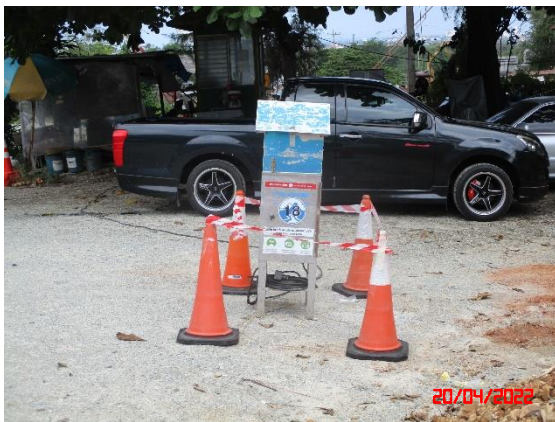
สำนักงานโรงโม่หินไทพิพัฒน์ (บจก. ศิลานคธ รับช่วงทำเหมือง)