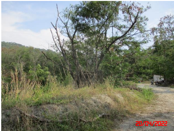
ค้นทำนบดิน