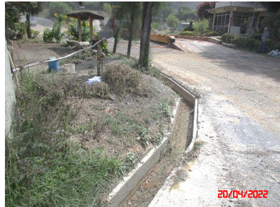
คูระบายน้ำ