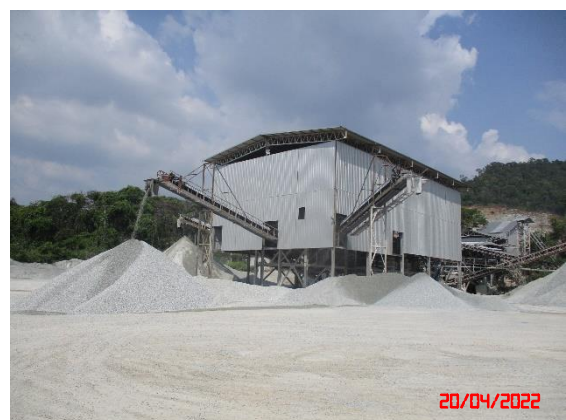
อาคารปิดคลุมโรงโม่หิน