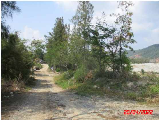
รูปที่ 2-16 แนวต้นไม้บริเวณพื้นที่เวนไม่ทำเหมือง