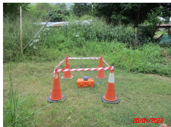
บ้านดอนกลาง