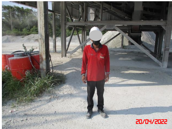
รูปที่ 2-12 การตรวจวัดคุณภาพอากาศ ระหว่างวันที่ 20-21 เมษายน 2565