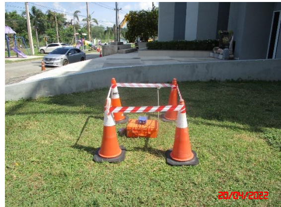
บ้านดอนบน