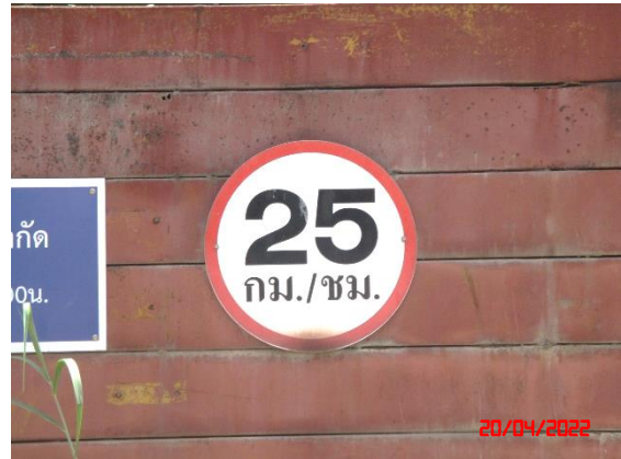
ป้ายจำกัดความเร็ว