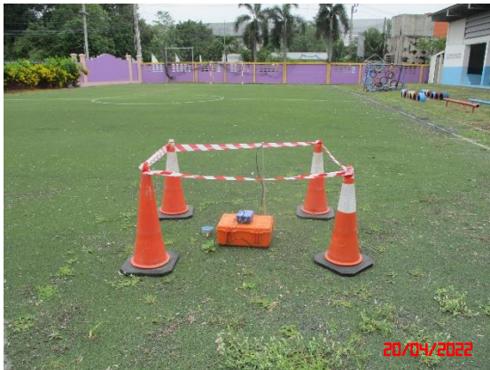
บ้านไร่ไทรลำ