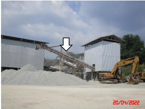
หลังคาปิดคลุมสายพานลำเลียง