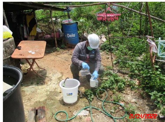
น้ำบ่อต้นบ้านดอนบน