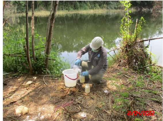
สระน้ำบ้านดอนบน