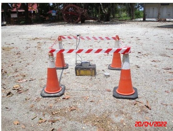
วัดหน้าเขาบ่อยาง