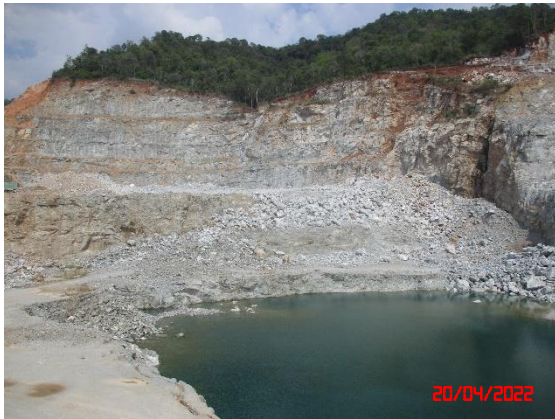
รูปที่ 2-1 ลักษณะหน้าเหมืองของโครงการ