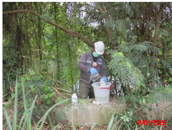
สระน้ำบ้านดอนกลาง