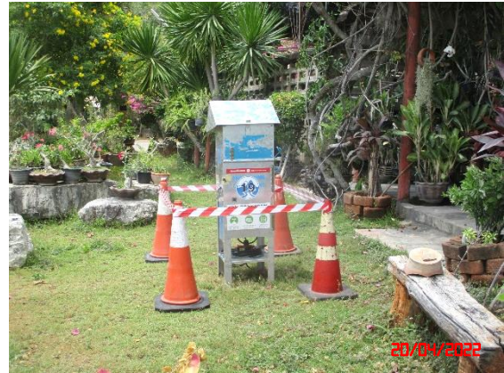
สำนักงานโรงโม่หินของโครงการ