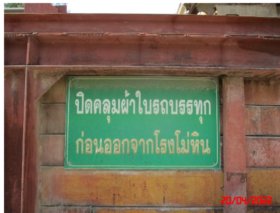
ป้ายเตือนให้ปิดคลุมผ้าใบรถบรรทุก