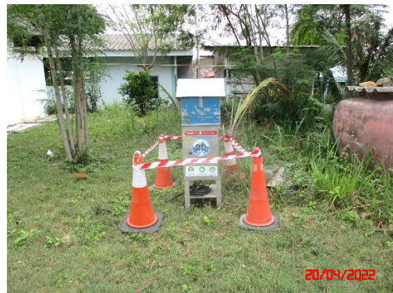
ชุมชนบ้านดอนกลาง