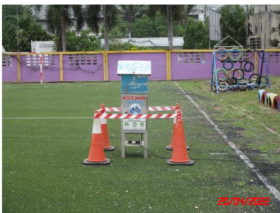
ชุมชนบ้านไร่ไหลลำ