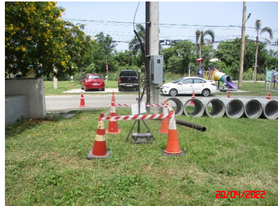
บ้านดอนบน