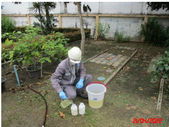
น้ำบ่อต้นบ้านไร่ไหลลำ