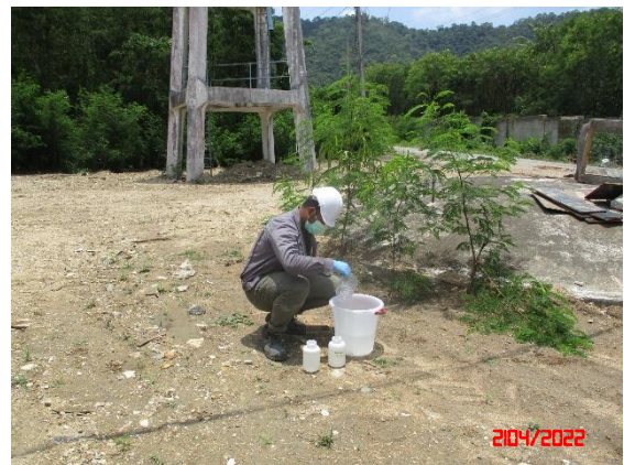
น้ำบาดาลบ้านดอนบน