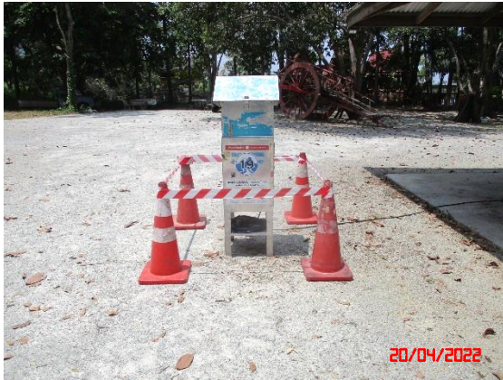
วัดหน้าเขาบ่อยาง