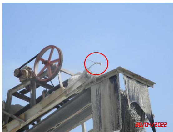
ระบบสเปรย์น้ำบริเวณปลายสายพานลำเลียง