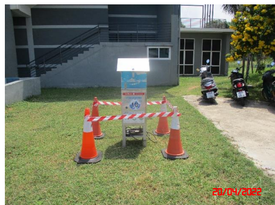
บ้านดอนบน